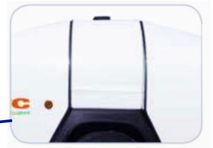
600 L watertank / 75 L dieseltank