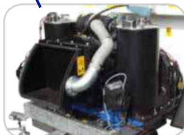
Dubbele brander mogelijk