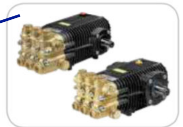
RW/TW Premium pomp Snaar aangedreven